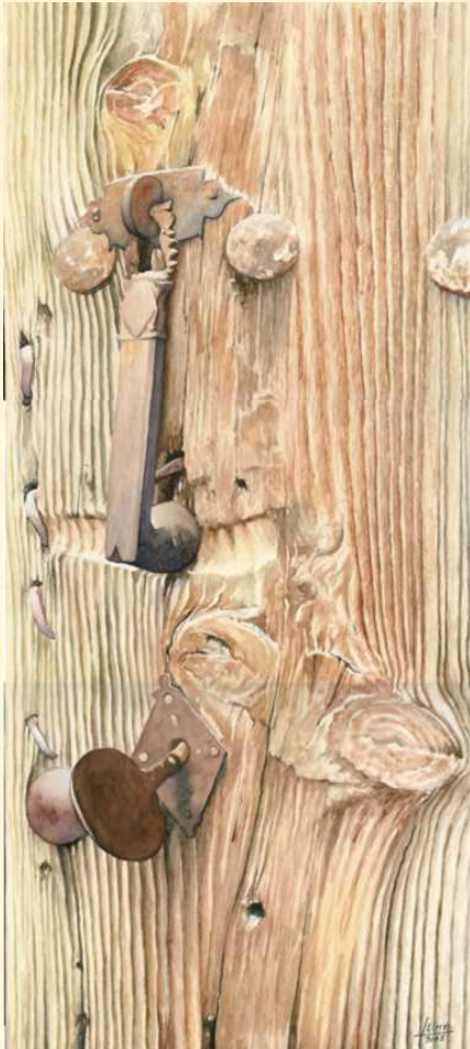
Llamador del rombo