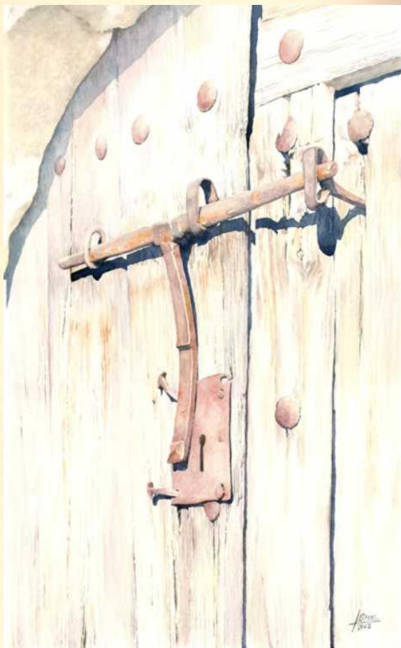
Cerrojo en una puerta de Calzada