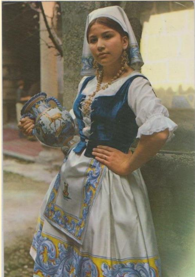
Postal antigua del traje típico (Talavera de la Reina)