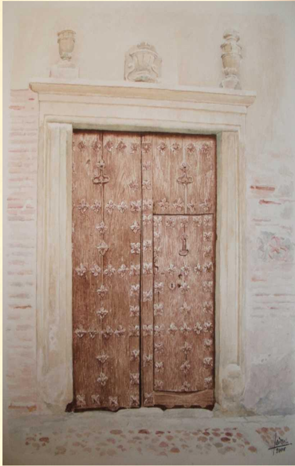
Una puerta en Toledo